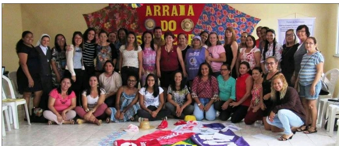
Figura 3 – Curso de Formação Política de Mulheres no SINSEMBA/CE

Também cabe destacar a importância do curso para a equipe formadora, impactando diretamente os processos educacionais de sete estudantes dos cursos de Bacharelado em Humanidades, História, Sociologia e Pedagogia. Além das cursistas e dos agentes formadores, o curso atingiu um público de aproximadamente 250 mulheres, com as rodas de conversas promovidas nas localidades de Barreira, levando conhecimentos acadêmicos e processos formativos inovadores para locais de difícil acesso, como a Zona Rural de Barreira. A culminância do curso deu-se em espaço público, com ato político na feira livre do município e passeata pelas principais ruas da cidade, puxada pelas mulheres participantes do curso. A passeata findou na sede do sindicato de Barreira, onde foi realizado o encerramento, com a entrega de certificados às cursistas e equipe organizadora.