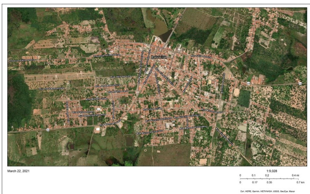
Figura 1 – Cidade de Barreira/CE.

Barreira é um município brasileiro do estado do Ceará, localizado na macrorregião do Norte Cearense, distante de Fortaleza com especificamente 72 km, limitando-se, ao Norte, com a cidade de Acarape; no Leste, com Chorozinho; no Sul, com Aracoiaba e Ocara; e, no Oeste, com Redenção. Foi fundada no dia 15 de abril de 1987, com a população estimada pelo IBGE, em 2020, de 19.574 habitantes, sendo denominados como “gentílicos” pelo próprio IBGE, mas popularmente chamados de “barreirenses” (IBGE, 2020). O primeiro nome da cidade (Barreira Vermelha) faz alusão ao solo, um barro de cor avermelhada existente em todo o seu território. Tem como economia a pecuária, a extração do caju e seu beneficiamento, como, por exemplo, a produção de suco, carne de caju, amêndoas, etc. Produz, também, algodão, banana, milho, feijão e mandioca; além dos empregos oferecidos pela prefeitura, comércio e as minifábricas. Na cultura do município, os principais eventos são: festa do padroeiro de São Pedro (28 de junho), Festa do Chapéu (em julho) e o Fest Rock.