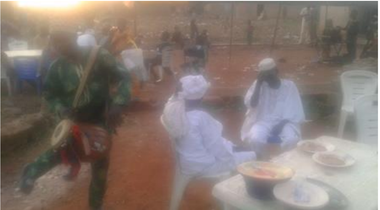
Àwòrán 11: Oníyàá ilù kete ká ẹ̀sẹ̀ kan sókè nígbà tí ó ń jó bí ó ẹ̀ ń lu ilù

Nínú àwòrán 11 òkè yẹn, a rí oníyàá ilù kete, tí ó ń lùlù fún àwọn olùsin òrìṣà Alará-Igbó, tí wọn wọ aṣọ funfun, tí wọn sì jókòó yẹn, bí ó ẹ̀ ká ẹ̀sẹ̀ kan sókè nígbà tí ó ń jó, tí ó sì ń lu ilù náà ní ẹ̀kòòkan. Àmì ifimòsílára igbádùn iṣeré hàn ni a lérò pé èyí jẹ. Ó sì tún jẹ àpẹẹrẹ̀ ìmọ̀-ọ̀ṣẹ̀ tó lóòrìn, èyí tí ọ̀ṣeré náà ní. Kò sí àní-àní pé bí ọ̀ṣeré yìí ẹ̀ ẹ̀ náà fi í hàn gégé bí akòṣẹ̀mọ̀ṣẹ̀ tí ó dáhgájía nínú ilù kete lílù. Bákan náà ni ọ̀rò ẹ̀ rí pẹ̀lú oníyàá ilù agbè tí a fi hàn nínú fòtò 12 ìsàlẹ̀ yìí: