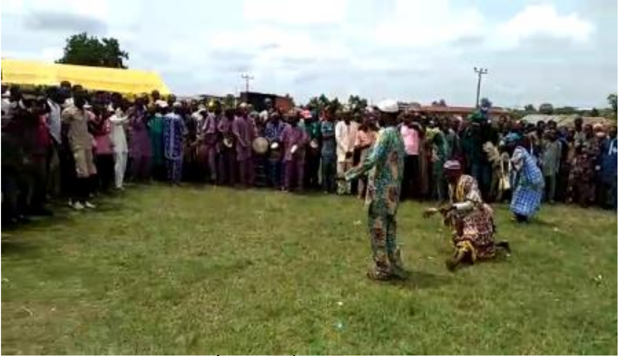
Àwòrán 1: Ilù jíjá lórí ikúnlè

Láti já ilù nínú ìṣeré orin kete, òṣèré le dá oríṣíríṣi àrà. Ó le wà ní òòró, ó le wà ní ikúnlè tàbí idòbálè. Òṣèré le fi apá já ilù kete, ó le fi ẹṣẹ já ilù, ó le fi orí já a, ó sì le fi èjìkà já a. Èyí wà lówò bí òṣèré bá ẹ mọ ijó jó tó, àti bí ó ẹ gbọ ohùn ilù kete tó. Àpẹẹẹ àwòrán ilù jíjá nínú orin kete niyí nínú àwòrán onífótò 1 àti 2 ìsàlẹ̀ yìí: