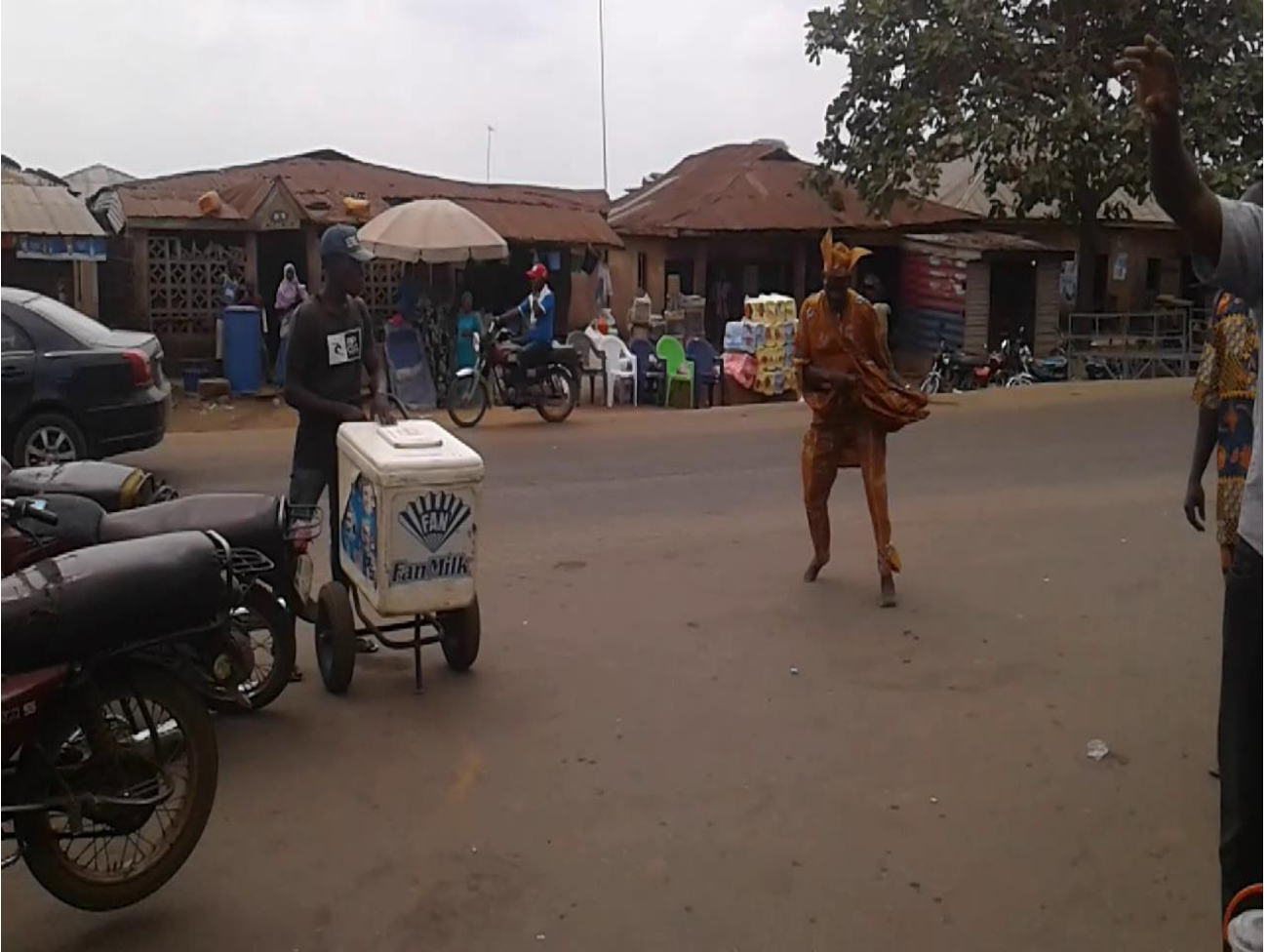
Àwòrán 17: Akitiyan oníjò láti jó ijó yopáyosè/ẹlẹyọ-ẹyọ

Ó yẹ kí á tún yán an pé ijó ẹlẹyọ-ẹyọ/ yopáyosè tí ajágbè jó nínú àwòrán 17 tún yàtò díẹ sí ti inú àwòrán 4 nítorí pé ti àwòrán 17 yẹn mú ipá díẹ lówọ. Pèhnpèkun ni ajágbè n jà nínú ijó àwòrán 17 kí í ẹ yíyá agbè bíi ti ajágbè inú àwòrán 4. Láti jà pèhnpèkun nínú ijó yopáyosè/ ẹlẹyọ-ẹyọ gégé bí ajágbè ẹ jà a nínú àwòrán 17 yíi nílò iyára kánkán àti ipá, kí oníjò le tẹlẹ iwọhùn iró agbè bí ó ẹ tọ àti bí ó ẹ yẹ. Àmi ijó líle àti eré ipá tí ijó agbè jẹ ni irú ijó yopáyosè bẹẹ dúró fún nínú orin agbè. Ó sì tún dúró bí àmi ịṣewékú pẹlú iwọhùn iró agbè lásìkò ịṣeré.