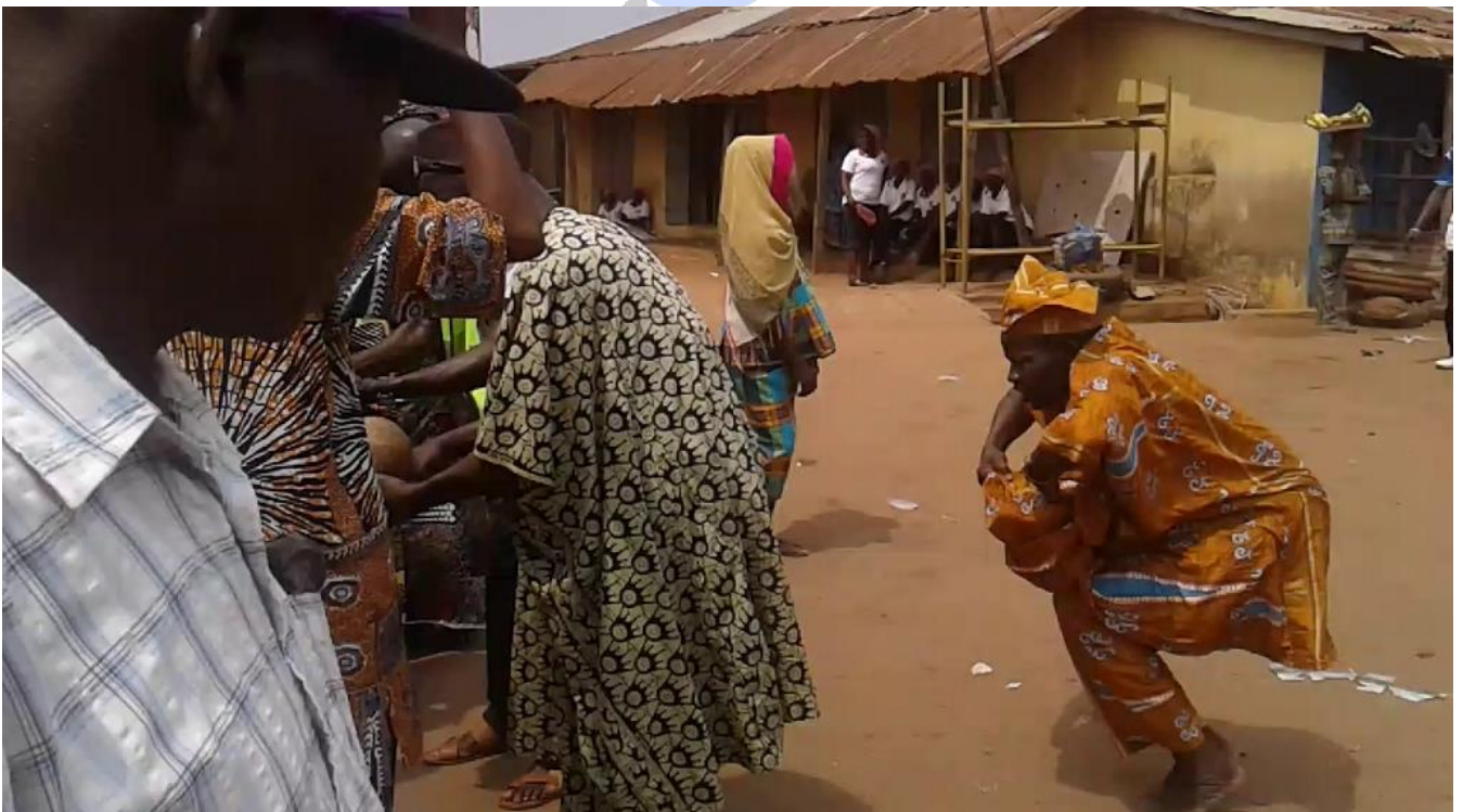
Àwòrán 20: Ajágbè fi igorí eṣẹ̀ tilẹ̀, ó sì gbìyànjú láti jó ijó mètaméta-èlà

Gégé bí a ti sọ, igbìyànjú lásán ni èyí; àwọn oníjò méjèèjì inú àwòrán 19 jó nítòótó, ní pàtàkì jùlọ, ajágbè kejì tí ó wọ ṣapará yẹn, ṣùgbón wọn kò le fi eṣẹ wọn fọ ilẹ̀ gégé bí Láṅgabà ti máa á ṣe ní ayé àtíjọ nígbà tí ó bá n jó ijó nàà.