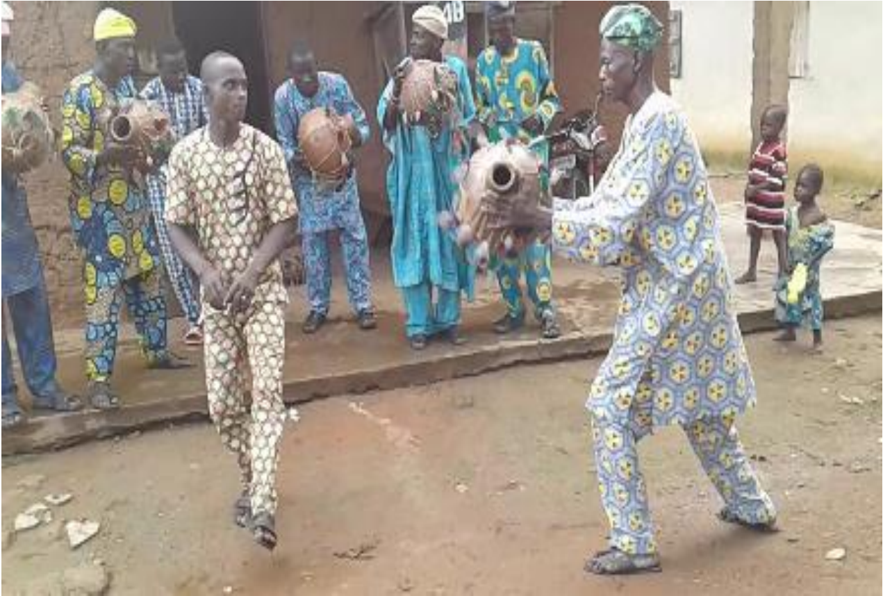
Àwòrán 4: Oníjò na owó rè méjèèjì àti ẹ̀sẹ̀ rè òsì sí iwájú láti já agbè

Bí a bá wo àwọn oníjò orin agbè méjèèjì tí a fi hàn nínú àwòrán 3 àti 4 yẹn, níṣe ni wọn na owó wọn àti ẹ̀sẹ̀ wọn láti já agbè. O hàn kedere pé oníjò inú àwòrán 3 múra sí ijó tí ó n jò gidigidi; gbogbo agbára àti ipá rè ni ó fi n jò o, sùgbọn bí ẹ̀ni n jò ijó gbèfẹ̀ ni oníjò inú àwòrán 4 ẹ̀ n já agbè ní tirẹ̀. Pẹ̀nṣẹ̀kun ni ajágbè inú àwòrán 3 n já sùgbọn iyá agbè ni ajágbè inú àwòrán 4 n já ní tirẹ̀. Àwọn méjèèjì ní ó n tẹ̀lé iwọ̀hùn agbè tí wọn n jò náà láti fi hàn pé ọ̀sẹ̀ré agbófèé ni àwọn. Nípa ẹ̀sẹ̀ báyii, àmì ìmò-òn-ẹ̀ nínú ijó àti gbígbọ̀ ohùn agbè ni èyí jẹ̀. Jíjá pẹ̀nṣẹ̀kun gégé bí oníjò ẹ̀ ẹ̀ nínú àwòrán 3 jẹ̀ àmì bíbá iwéhùn agbè lọ. Nítorí pé pẹ̀nṣẹ̀kun yíi ẹ̀rọ́ ó já, tí ó sì pọ̀ dandan kí jíjá rè bá iwọ̀hùn agbè lọ, ó nílò agbára àti ipá. Àmì ipá àti agbára lílò láti já ilù agbè ni pẹ̀nṣẹ̀kun jíjá tún dúró fún nínú orin agbè. Iyá agbè jíjá kò gba agbára àti ipá bí jíjá pẹ̀nṣẹ̀kun ní tirẹ̀.