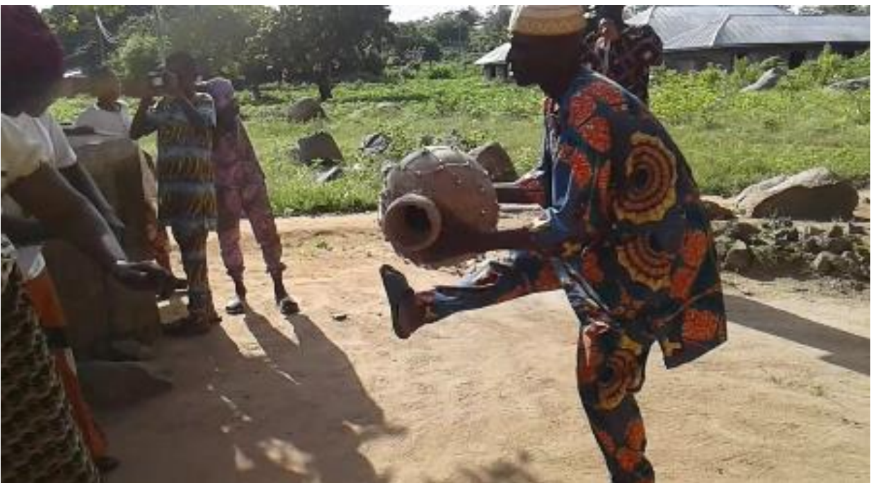
Àwòrán 12: Oníyàá ilù agbè gbé ẹ̀sẹ̀ ọ̀tún sókè láti já agbè

Nínú àwòrán 11 òkè yẹn, a rí oníyàá ilù kete, tí ó ń lùlù fún àwọn olùsin òrìṣà Alará-Igbó, tí wọn wọ aṣọ funfun, tí wọn sì jókòó yẹn, bí ó ẹ̀ ká ẹ̀sẹ̀ kan sókè nígbà tí ó ń jó, tí ó sì ń lu ilù náà ní ẹ̀kòòkan. Àmì ifimòsílára igbádùn iṣeré hàn ni a lérò pé èyí jẹ. Ó sì tún jẹ àpẹẹrẹ̀ ìmọ̀-ọ̀ṣẹ̀ tó lóòrìn, èyí tí ọ̀ṣeré náà ní. Kò sí àní-àní pé bí ọ̀ṣeré yìí ẹ̀ ẹ̀ náà fi í hàn gégé bí akòṣẹ̀mọ̀ṣẹ̀ tí ó dáhgájía nínú ilù kete lílù. Bákan náà ni ọ̀rò ẹ̀ rí pẹ̀lú oníyàá ilù agbè tí a fi hàn nínú fòtò 12 ìsàlẹ̀ yìí: