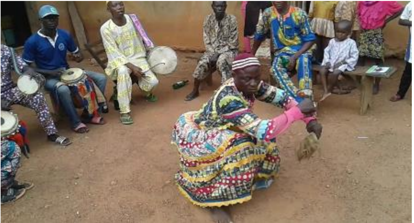
Àwòrán 15: Aboyèrì n yatan, ó n pa itan dé láti jọ ijó yíyatan-pípatandé nínú ṣeré orin kete

Orí ilòṣòò ni aboyèrì tí máa n jọ ijó náà, tí yóò sì máa yatan rẹ, tí yóó máa pa á dé gélẹ bíi igbà tí obìnrin tó ya aṣa bá n jọ, tí ó n fẹ abẹ rẹ sí àwọn òhùwòran. Bí aboyèrì bá tí n ṣe èyí, àwọn òhùwòran ó máa hó gèè, wọn yóò sì máa rẹrìn-in nítorí bí òṣeré yíi ṣe n ṣe yíi. È jẹ kí á wo àpẹrẹ ijó yíyatan-pípatandé nínú fòtò 15 ìsàlẹ̀ yíi: