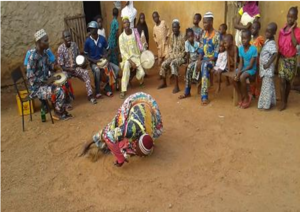
Àwòrán 7: Ìyíkàá nínú orin kete

Nínú orin kete ni ìyíkàá wọ̀pọ̀ sí jùlọ̀ sùgbọ̀n a máa jẹ̀ yọ̀ nínú orin agbè náà. Ẹ̀ jẹ̀ kí á wo àpẹ̀rẹ̀ rẹ̀ nínú àwọn àwòrán onífòtò 7 àti 8: