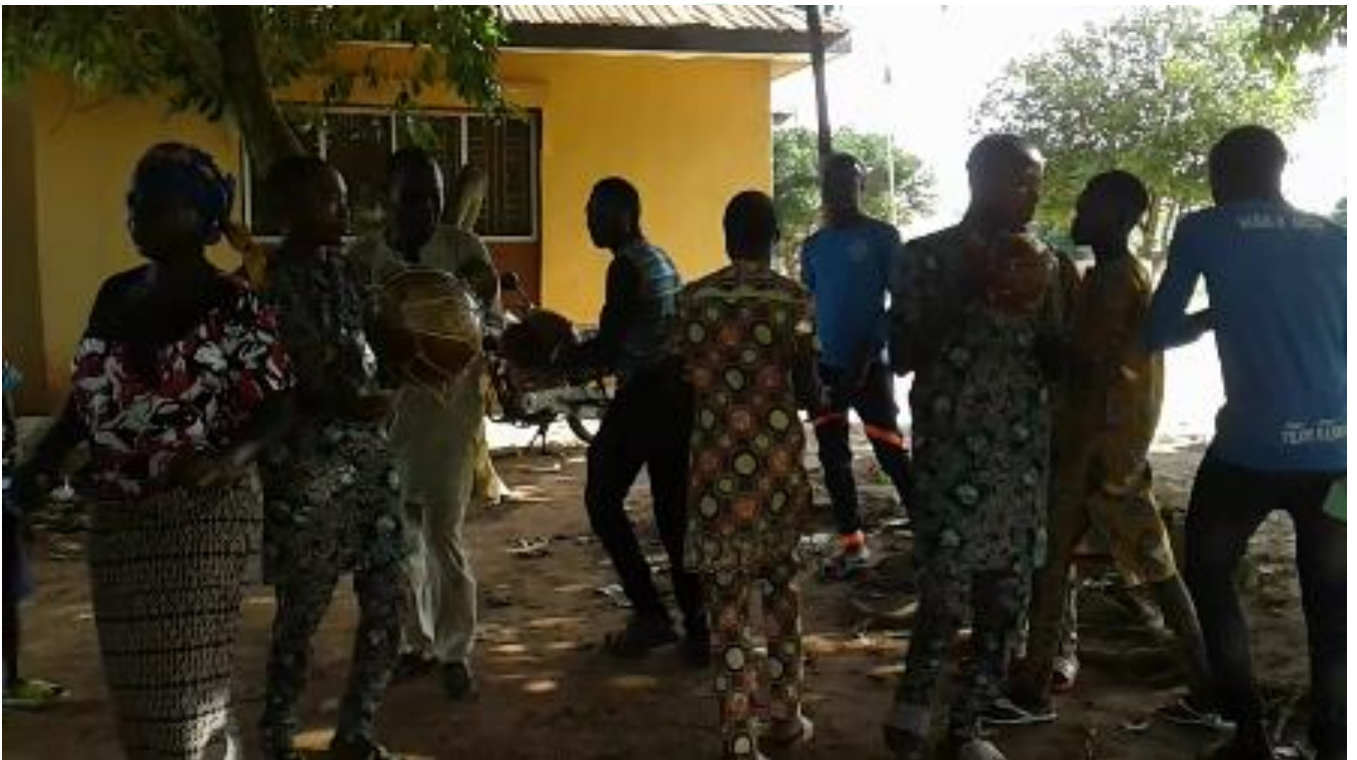
Àwòrán 13: Àwọn onilù orin agbè pín ara wọn sí ọ̀wọ̀ méjì láti jó yípo agbo nínú ijò olóbìírìpobírí

Olóbìírìpobírí ni orúkọ ijò tí àwọn ọ̀sèrẹ̀ ti máa n̄ tò yípo ara wọn láti pe ara wọn níjà nínú orin agbè. Bírípo ni wọn n̄ pe irúfẹ̀ ijò tí ó fara pé ẹ nínú iṣeré orin kete. O hàn gbangba pé orúkọ àwọn ijò méjèjè yí fi ara pé ara nípasẹ̀ ìrísí àwọn iró ohùn àti ihun wọn. Kò sí àní-àní pé láti inú “bírípo”, tí ó jẹ ọ̀rọ̀ onihun kùkurú ni a ti ẹ̀dà ‘olóbìírìpobírí’, tí ó jẹ ọ̀rọ̀ onihun gígùn. A ẹ̀dà “bírípo” gan-an fúnra rẹ̀ láti inú àkànpọ̀ “bírí” àti “po” (bírí + po = bírípo). Nígba tí a wá so mọ̀fìmù aláfòmọ̀ ibèrẹ̀ asọ̀dorúkọ ‘ò-’ mọ̀ bírípo (ò- + bírípo), àyọ̀rísí àsomọ̀ náà jẹ ‘òbírípo.’ Nígba tí a ẹ̀ àwítúnwí ẹ̀lẹ̀bẹ̀ fún ọ̀rọ̀ tuntun yíí ó di ‘òbírípobírí.’ Nígba tí a tún wá fi mọ̀fìmù aláfòmọ̀ asọ̀dorúkọ ‘oní-’ kún ọ̀rọ̀ àbájáde yíí (oní + òbírípobírí) ni ọ̀rọ̀ náà di ‘ olóbìírìpobírí.’ Ẹ̀ jẹ́ kí á wo àpẹ̀rẹ̀ àwòrán fòtò 13 isàlẹ̀ yíí níbi tí àwọn ọ̀sèrẹ̀ orin agbè ti jó ijò olóbìírìpobírí.