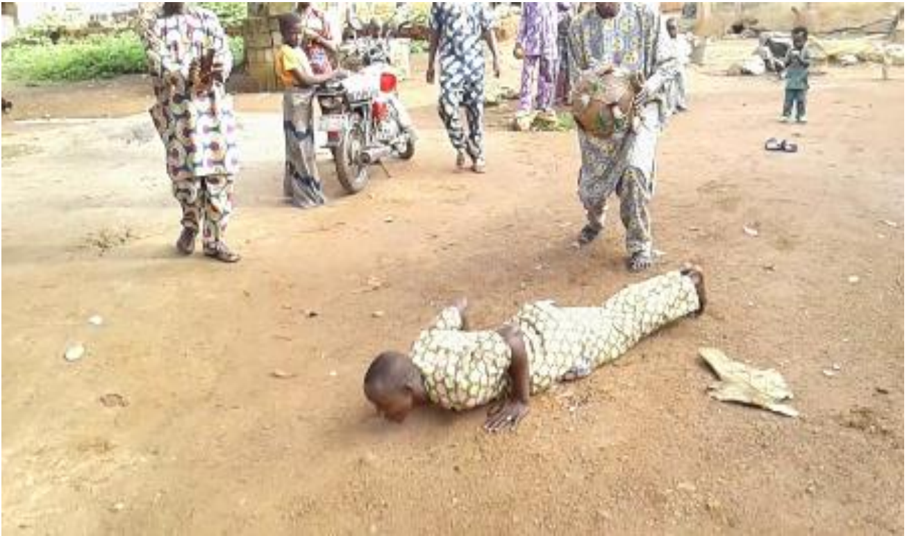
Àwòrán 5: Oníjò orin agbè dọbálẹ láti júbà