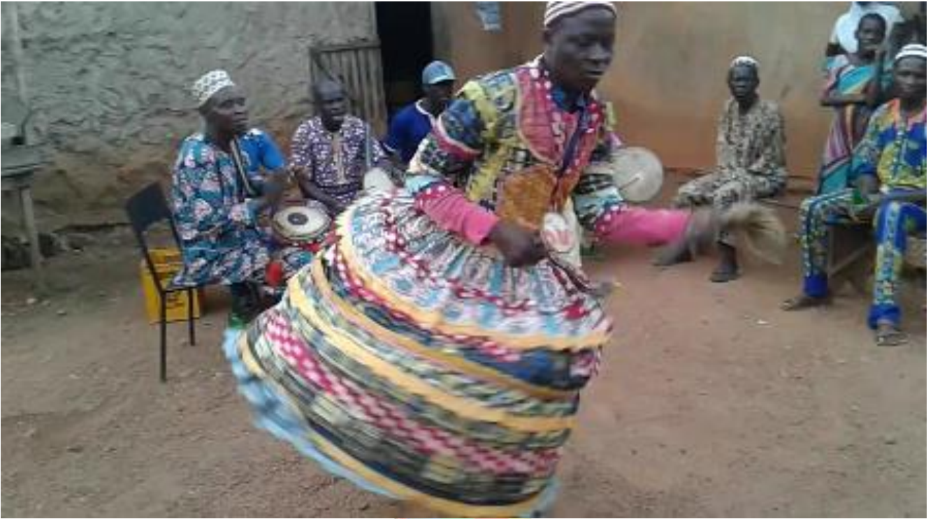
Àwòrán 14: Abòyèrì n pòyì rànḥìn láti jó bírípo nínú iṣeré orin kete

la ó maláre”, (i.n.p. Òní ni a ó mọ ẹni tí ó mọ ijó jó jù lọ). Níorí náà, a lè sọ pé àmì ìpèníjà fún iṣeré tó gbayi-gbèyẹ ni ijó yìí jẹ nínú iṣeré orin agbè. Ẹ jẹ kí á wo fótò 14 fún àpẹẹrẹ ijó bírípo nínú iṣeré orin kete