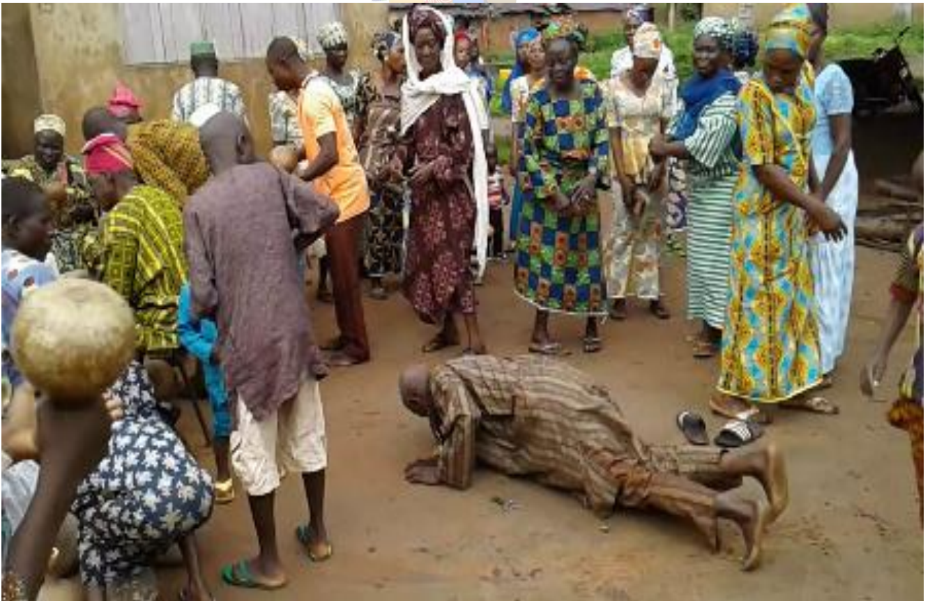
Àwòrán 6: Oníjò orin agbè mìràn dọbálẹ láti júbà