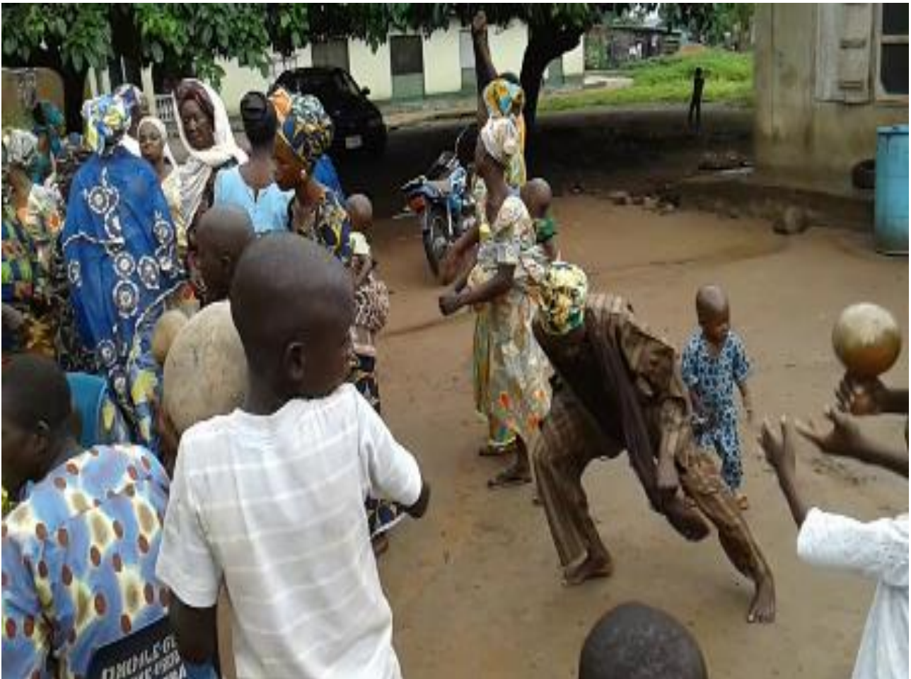
Àwòrán 3: Oníjọ̀ na ẹ̀sẹ̀ àti ọ̀wọ̀ rẹ̀ ọ̀sì sí ẹ̀gbẹ̀ kan láti já agbè

Ajágbè a tún máa fi agbè tó n̄ já hàn nípa sísún mọ̀ onílù tó n̄ lu agbè yíí kí ó le jó o dáradára. Síbẹ̀ nàà, iyá agbè ni àwọn ajágbè sáábà máa n̄ já jùlọ̀ bí a ti sọ̀ tẹ̀lẹ̀. Agbè tó sì tẹ̀lẹ̀ e, tí wọn máa n̄ já, ni pẹ̀h̄pẹ̀kun/ pẹ̀h̄pẹ̀ tí a ti dárúkọ̀. Ẹ̀ jẹ̀ kí á wo àpẹ̀rẹ̀ agbè jíjá inú àwòrán onífótò 3 àti 4 isàlẹ̀ yíí: