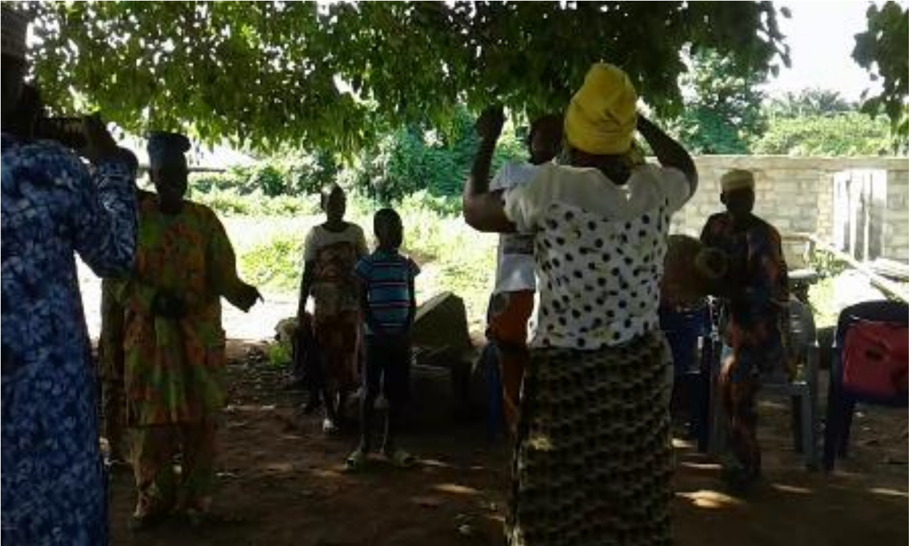
Àwòrán 18: Àwọn obinrin oníjò agbè wònyí fò sókè láti jó ijó fò-lálá

Bí a bá wo àwòrán 18 yíí, a ó rí i wí pé àwọn obinrin méjèèjì wọn dojú kọra káwọ sókè nígbà tí wọn n fò sókè bí wọn ti n jó ijó fò-lálá ni. Ìpènijà láti mọ bí ara oníjò ẹe dáńgájá sí ni ijó fò-lálá n tọka sí nínú iṣeré orin agbè, nítorí náà, àwọn ọ̀dọ̀mọ̀dé tí eegun wọn le dádádára ni ó máa n jó o. Torí pé obinrin tó kojú sí èkejì rẹ̀, tó dé filà aláwọ̀ èsúrú nínú àwòrán 18 náà kò lómi lára ni ó ẹe ní àhfaaní láti fò sókè dádádára ju èkejì, tí ó dé filà náà, tí ó sì kẹ̀yìn sí ayafótò lọ. Àmì láti fi hàn bí ara ẹni ẹe fẹ̀rẹ̀ tó ni ijó fò-lálá jẹ.