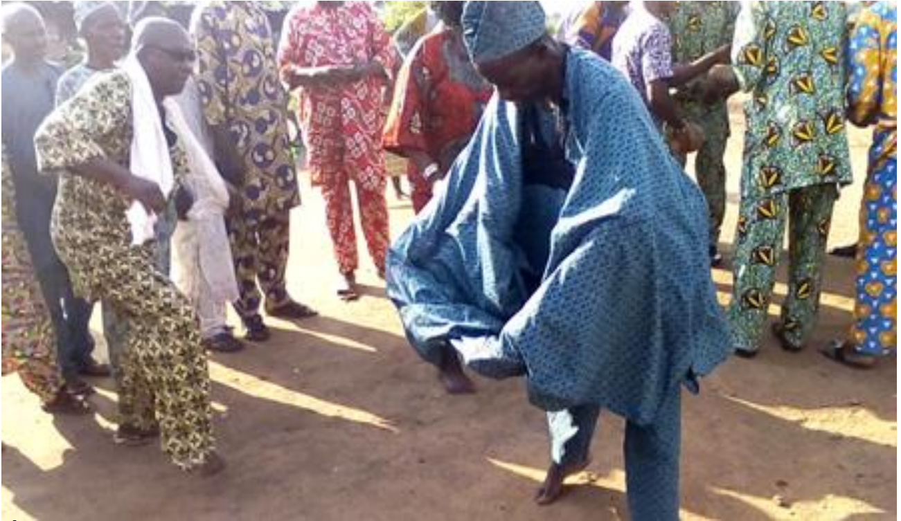
Àwòrán 19: Oníjò agbè kìn-ín-ní tí ó fi aṣọ funfun kòrùn àti èkejì tó wọ ṣapará n gbíyànjú láti jó ijó mètaméta-èlà

Gégé bí a ti sọ, igbìyànjú lásán ni èyí; àwọn oníjò méjèèjì inú àwòrán 19 jó nítòótó, ní pàtàkì jùlọ, ajágbè kejì tí ó wọ ṣapará yẹn, ṣùgbón wọn kò le fi eṣẹ wọn fọ ilẹ̀ gégé bí Láṅgabà ti máa á ṣe ní ayé àtíjọ nígbà tí ó bá n jó ijó nàà.