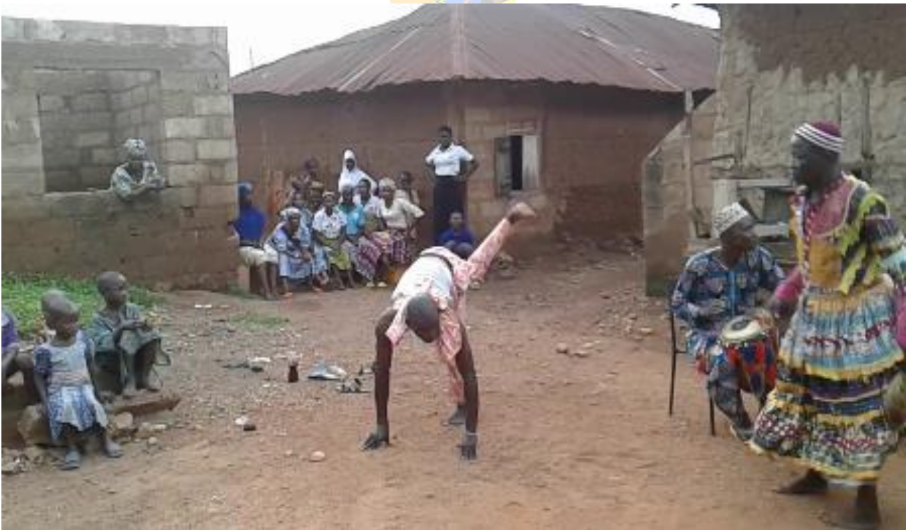
Àwòrán 2: Ilù jíjá nípa kíkà ẹṣẹ kan sókè