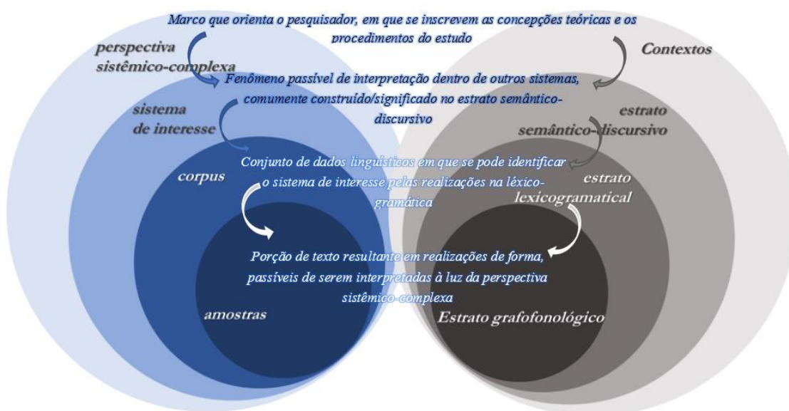
Figura 2 – Perspectiva sistêmico-complexa da pesquisa em linguagem

Dessa forma, tendo em conta o que já registrei, aportar o potencial da LSF e de sua perspectiva epistêmica/metodológica e, portanto, complexa, levou-me ao diálogo com Silva (2016) 5 , que apresenta alternativa à também válida terminologia de “objeto de estudo”, propondo ele que “sistema-de-interesse” se ajusta ao que fazemos em nossos estudos. Essas noções estão mais bem representadas na Figura 2, que compus a partir de círculos cotangenciais comumente vistos na LSF: