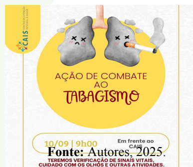
Figura 01: Cartaz informativo sobre a ação

Durante as abordagens, verificou-se que tanto o cigarro tradicional quanto os Dispositivos Eletrônicos para Fumar (DEFs) despertaram interesse entre os participantes. Muitos relataram dúvidas sobre os possíveis riscos associados aos cigarros eletrônicos, frequentemente percebidos como uma alternativa menos prejudicial em comparação ao cigarro habitual. Esse cenário evidenciou a presença de informações incompletas ou equivocadas acerca dessas tecnologias, reforçando a necessidade de ações educativas que abordem ambas as formas de consumo de nicotina.